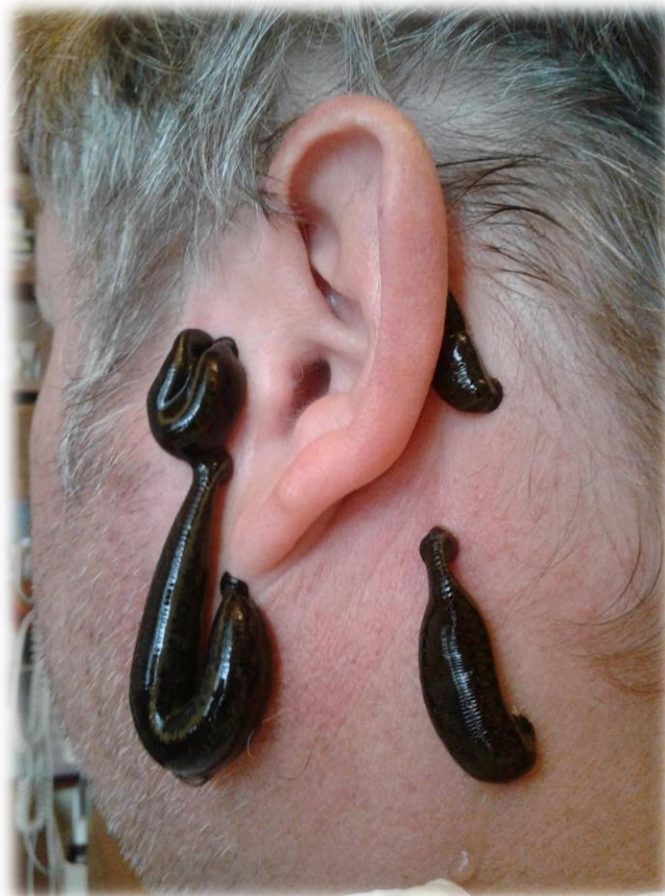
Bild: Behandlung Durchblutungsstörung des Ohres